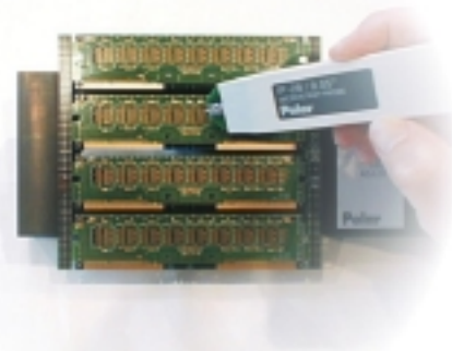
RIMM™モジュールへのプロービング

基板上にクーポンが組込まれている場合(例：Rambus® RIMM™モジュール)でも同様に測定ポイント・オリエンテーションは重要です。初期の RIMM デザインでは基板端部にそれぞれ 180 度回転したグラウンド・ポジションを持つ測定ポイントが使われていましたが、最近のデザインでは全ての測定ポイントが単一方向に規格されています。初期のラムバス・デザインの変更が必要な場合は Polar 社にお問合わせ下さい、変更承認の確認担当するラムバス社のスタッフにお繋ぎ致します。